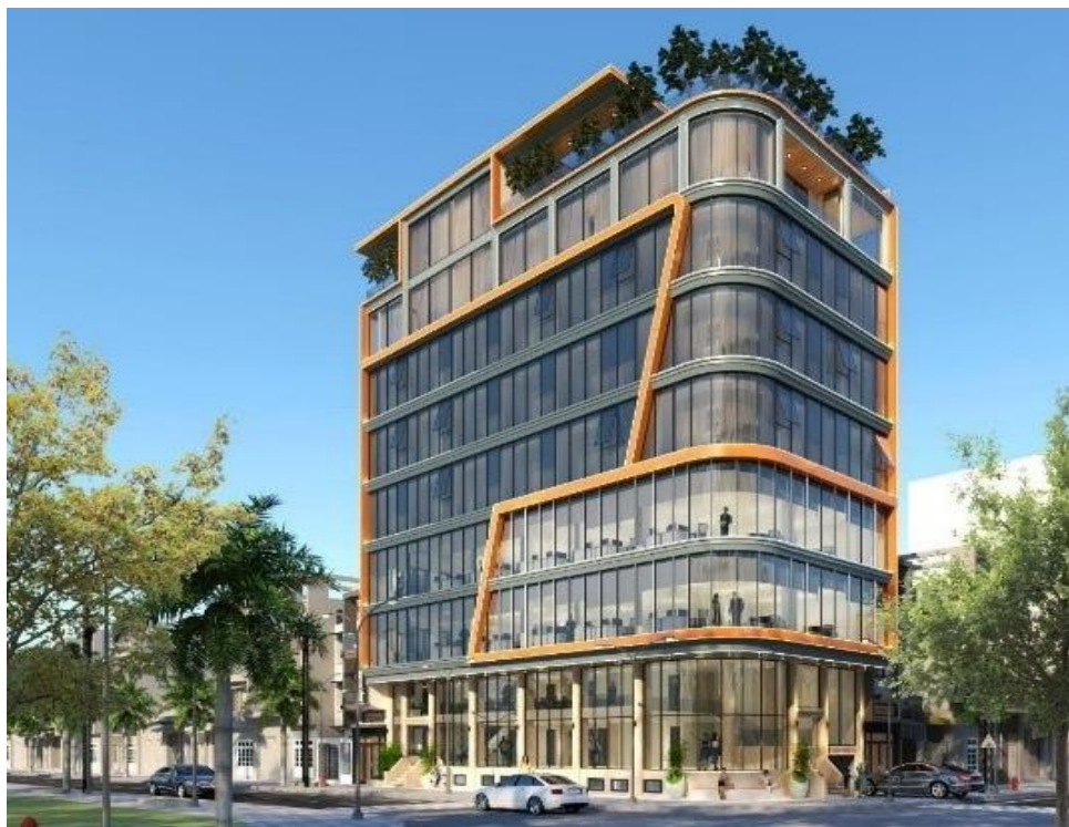
▲『Pasona DX Hub Da Nang』外観

2019年に、「日系企業の進出支援、人材育成・就職支援、観光促進支援」に関するMOU(覚書)を締結し、ビジネス交流を進めてきたベトナム・ダナン市において、先端テクノロジーを強みとしたグローバル体制を構築するため、2023年6月に先端技術ラボを新設。