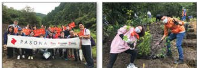
東京や千葉、名古屋を中心に植樹・育樹活動に参加

生物多様性に富んだ安定した防災・環境保全林を形成するためのふるさとの森づくり活動に参加。