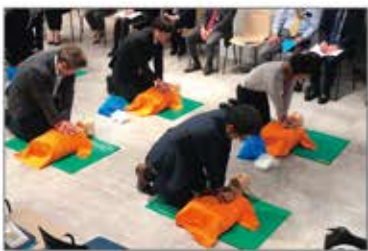
社内での講習を定期的開催