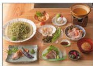
地産地消のメニューを提供するレストラン KABURAYA