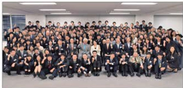
障害のある社員と健常者がともに働くパソナハートフル

「障害は個性、才能に障害はない!」をコンセプトに、働く意欲がありながら、就労が困難な障害者がイキイキと働ける環境と健常者と共に社会参加できる“共生”の場を創りだしてきました。特例子会社パソナハートフルをはじめ、グループ各社で個々の能力を活かして活躍の場を広げています。