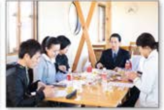
免疫力を高める食のあり方や身体に関する知識を学ぶ講座