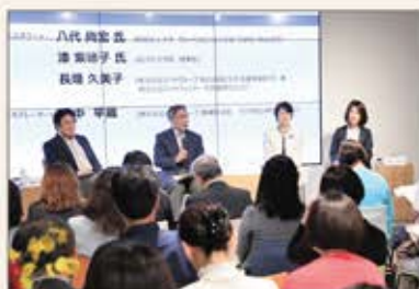
東京の会場と海外含む9拠点、及び在宅参加ができるよう、対面とオンラインのハイブリッド型で開催