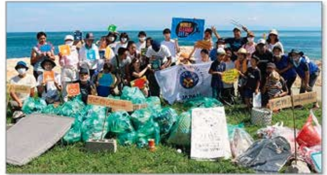
淡路島西海岸ビーチクリーン活動

「YUNGA JAPAN」と連携し、社員・エキスパートスタッフを中心に、SDGs達成に向け、環境問題に対する学びの場と一人ひとりが行動に繋げる機会を提供。プログラム修了者には参加認定証を発行し、環境問題への意識向上に繋げる取り組み。