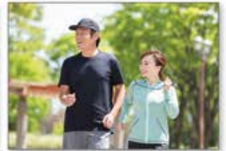
自然豊かな県立淡路島公園内をウォーキング