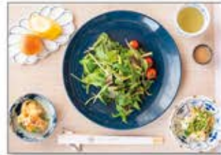
淡路島産の新鮮な野菜や発酵食品を使ったヴィーガン料理

生活習慣を改善したい、免疫力を向上させたいなど、健康的な生活と食習慣を身につけるためのヘルスケアプログラムを提供。