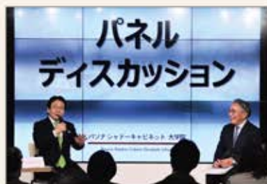
シャドーキャビネット大学院 第1回講義 左から竹中平蔵パソナグループ会長、内閣府規制改革推進会議委員 八代尚宏氏

社員一人ひとりがソーシャルアクティビストとして、社会課題に対する意識や提案力を高めるため、オンラインで開講。社外から有識者を講師に招き、講義形式及びディスカッション形式で専門的な知識や知見を学び、ソーシャルアクティビストとしての教養と提案力を養う。