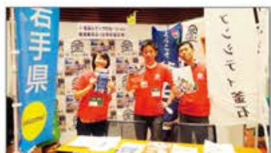
岩手県釜石市「釜石しごと・くらしサポートセンター」を運営

東北の地域課題を解決する実践型研修を通じて、人材を育てる研修ツーリズムと事業開発支援を推進。