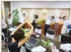
仕事の合間のリフレッシュエクササイズを定期的開催

パソナグループは「健康経営を進める企業の手本となっている企業」にも選出。経営トップの健康経営方針のもと社員一人ひとりが健康にイキイキと働き、ソーシャル・ワーク・ライフバランスを実践できるよう、健康環境の整備、ヘルスリテラシー向上のための研修、オンラインでの健康サポートプログラムなどを推進。