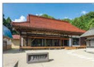
宿泊施設 平泉倶楽部

東北の素晴らしさを全世界に発信するだけでなく、地域が誇る食材にも注目。雇用創出と誰もが豊かさを感じる地域活性化を推進。