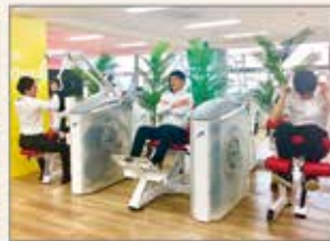
スーツのまま取り組めるトレーニングジム