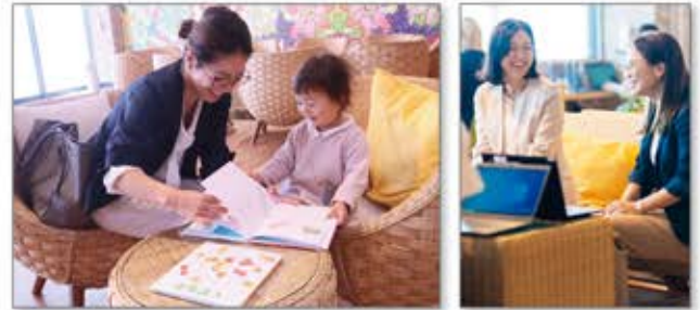
兵庫県淡路島での「仕事」と「育児」、「生活」をトータルに支援

雇用と生活の両面で困難な状況に直面する「ひとり親家庭」の方々に向け、仕事・住居・教育をトータルで支援するプロジェクトを今春より開始。淡路島で安心して仕事に従事できる環境と共に、自然の中で伸び伸びと子育てをしながら、充実した教育を受けられる環境を提供。