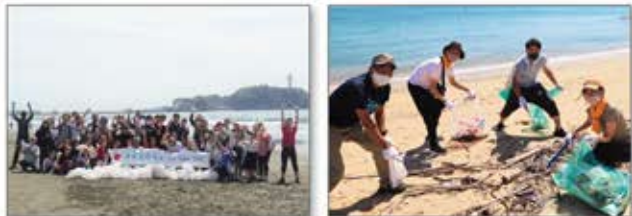
東北・関東・関西地方の海岸で活動を実施

各地域の美しいビーチの保存と海洋プラスチック問題の解決に向け、地域団体とも連携し、海岸清掃を実施。