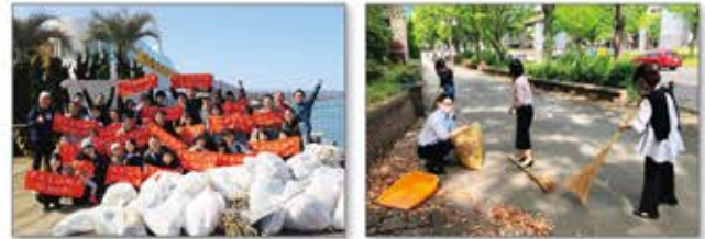
HELLO KITTY SMILE(淡路島)