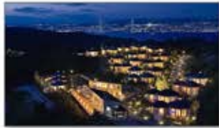
明石海峡大橋と神戸の街並みを一望

県立公園の最も高台に位置する淡路島随一のロケーション。地産地消にこだわり、四季折々の淡路島産の旬の食材を活かした創作料理は絶品。夜には対岸に広がる光輝く神戸の街並みと淡路島の満天の星を体感できる。