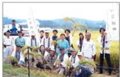
宮城県丸森町のブランド米「いざ初陣」を開発

震災からの復興を目指し、海外からのインバウンド促進を目的に起業。さらに、宮城県丸森町を拠点とした地域商社「GM7」、中国市場に特化した社会課題を解決する「日中BHEコミュニケーションズ」を設立、東北の未来創造に向けて活動。