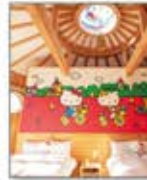
アニメの世界観を楽しめるキャラクタールーム