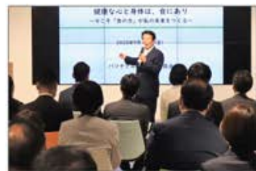
「健康な心と身体は、食にあり」をテーマにオンラインを活用したハイブリッド型で開催。

人々が心身ともに健康で心豊かな社会の実現を目指し、医学博士渡辺 昌氏を招いて「食」の安心・安全に関する情報を全国に発信。