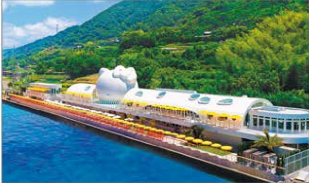
© 2021 SANRIO CO., LTD. APPROVAL NO. L627852

海をテーマにしたハローキティの世界をプロジェクションマッピングで体験。本格的な中華料理も楽しめる。