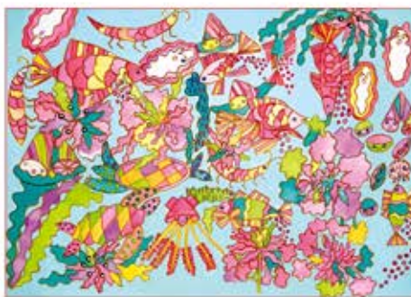
表紙の絵： 醍醐恵子「夏の海の魚たち」

「才能に障害はない」をコンセプトに、パソナハートフルで絵を描くことを仕事とする障害のあるアーティスト社員が、地球環境保全をテーマに、海の中の生き物を想像しながら描きました。イカ・エビ・サザエ・カメ・カキ・・・楽しい海の生き物を通して「海の豊かさ」への想いを馳せる作品です。