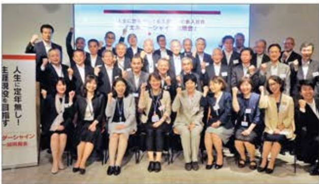
65歳からの新入社員「エルダーシャイン第2期生」同期会