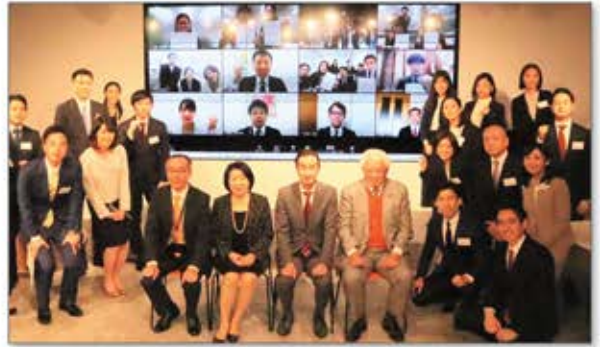
全国をつなぎ社会貢献活動報告会を年2回開催

<支援先> 令和2年7月豪雨、宮城県沖地震、アメリカ大寒波、東日本大震災復興、震災遺構保存等