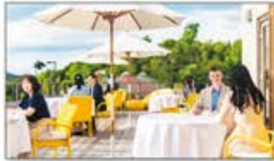
雄大な自然を眺めるダイニングテラス