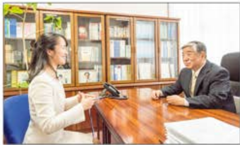
産業医・保健師による健康相談