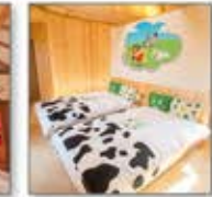
アニメの世界観を楽しめるキャラクタールーム