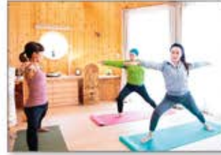
健康的な身体づくりを学ぶプログラムを提供