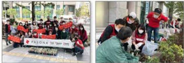
「東京ふれあいロードプログラム」に参画し、東京駅前外堀沿いの花壇管理を行う

花や緑でつまれた美しい街の実現に向けて、花壇管理や草花の植付け、清掃活動を実施。