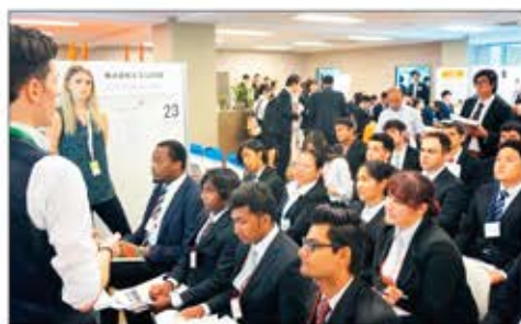
海外への渡航が制限され苦境に立つ留学生をサポート