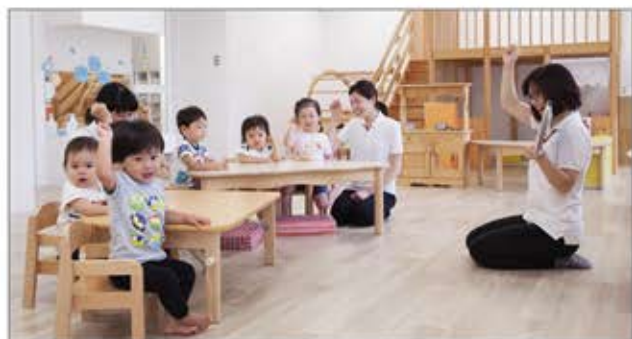
■ パソナファミリー保育園 「子育てしながら働きたい」と願う社員・エキスパートスタッフのための保育施設。JOB HUB SQUARE東京、淡路島でファミリーオフィスを展開